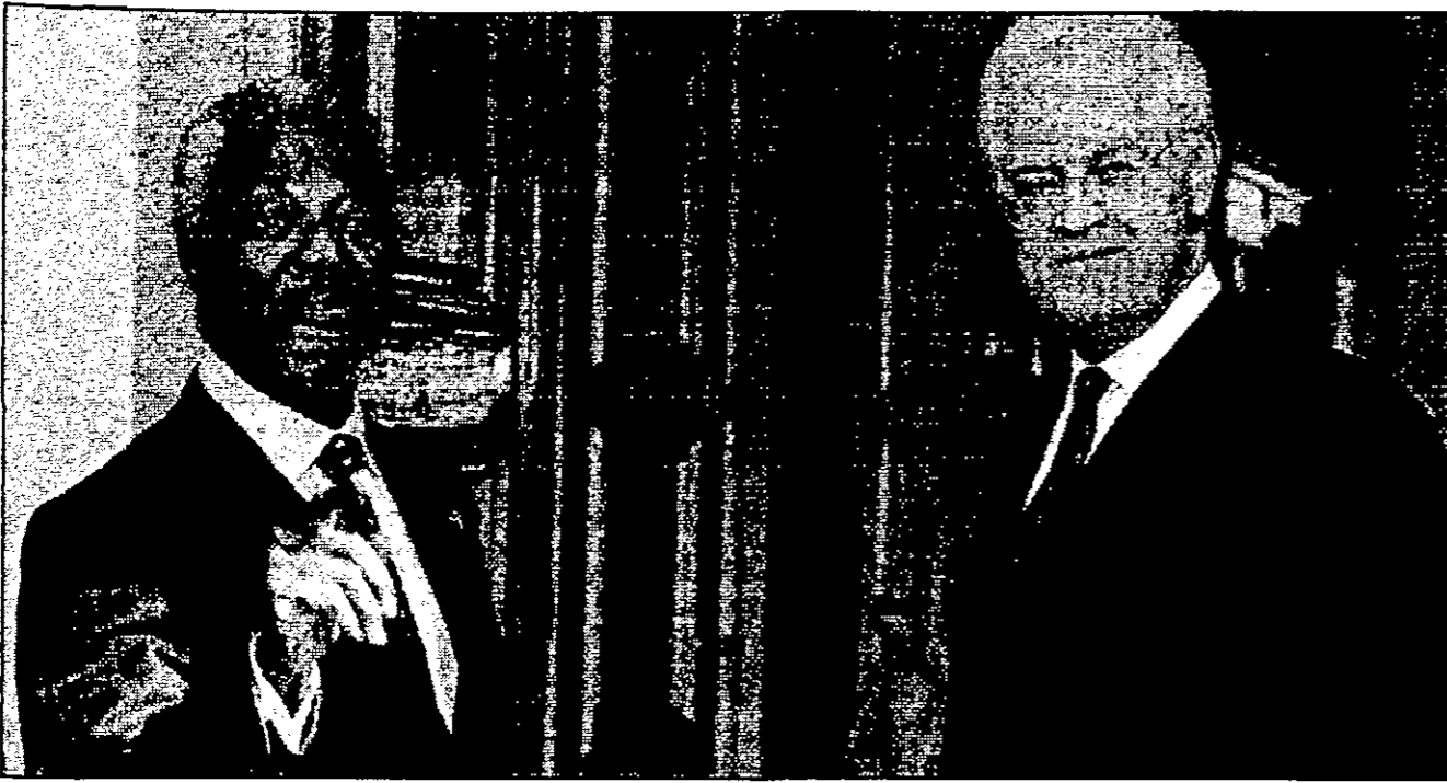
كونان ابن بقر إقامة الوزير الأول الفرنسي في جنيف اسس (رويتج)